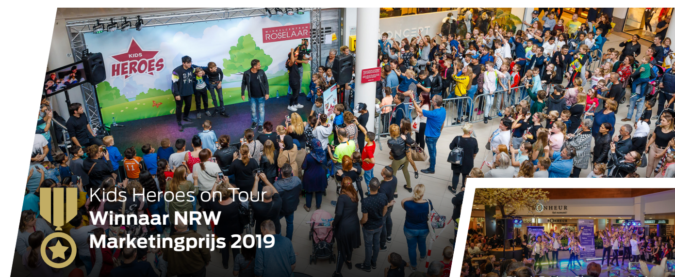
Kids Heroes on Tour Winnaar NRW Marketingprijs 2019